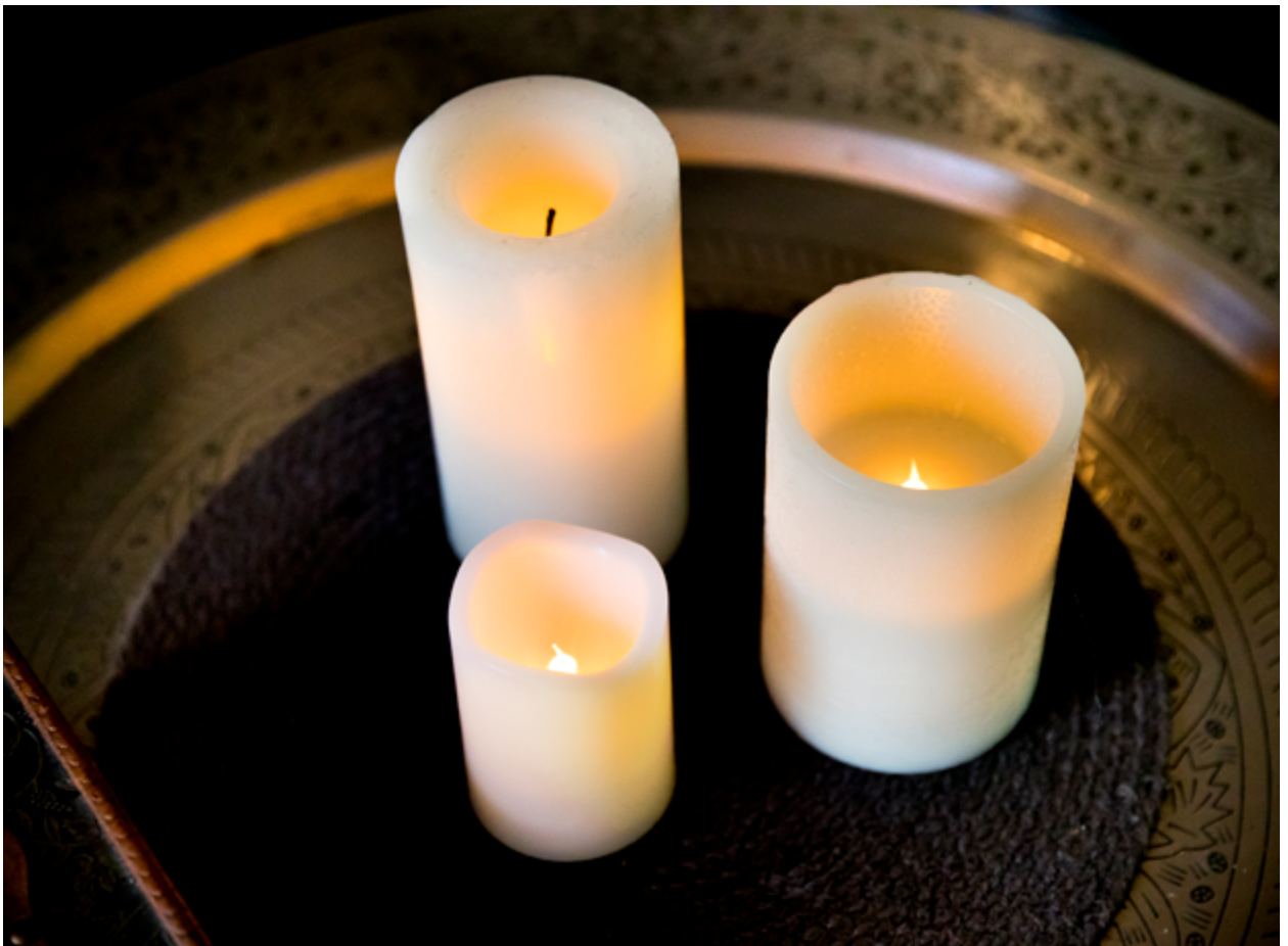
Ljus med batterier

Om en apparat har synliga skador, luktar bränt eller låter konstigt så kan det vara läge att byta ut den. Gamla glödlampor som blir väldigt varma kan ersättas med till exempel lågenergilampor, och levande ljus med batteriljus. Flertalet av dessa åtgärder bör övervägas hos alla, men särskilt hos personer som är riskutsatta.